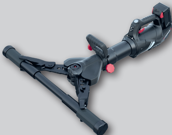
SPS 360 E-FORCE